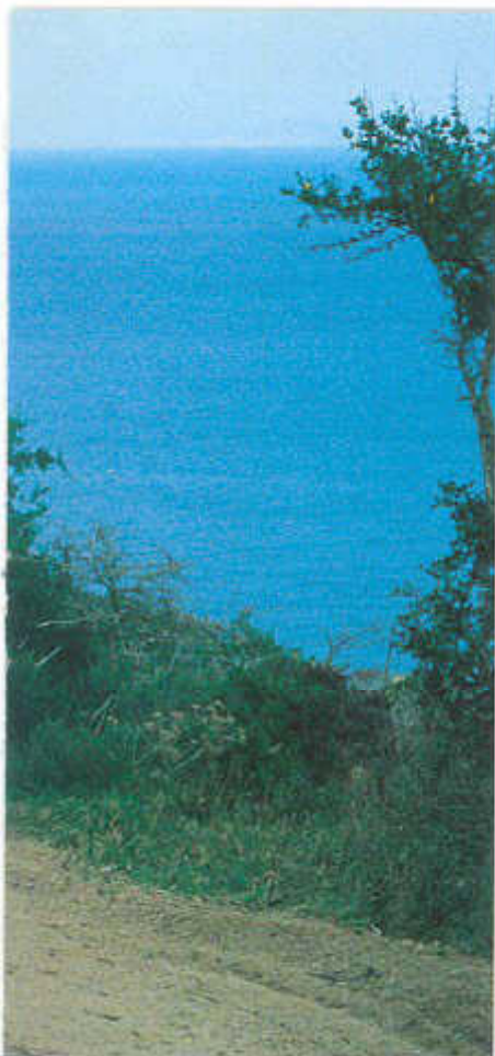
Die teils felsige Küste Elbas bot eine traumhafte Kulisse für die elfte Ausgabe der Transitalia

jahr der Campingplatz Lacona Pineta direkt am Meer. Hier waren die Piloten im Wohnmobil oder Bungalow untergebracht, hier fanden die technische Abnahme und das allabendliche Briefing statt, das übrigens ex-